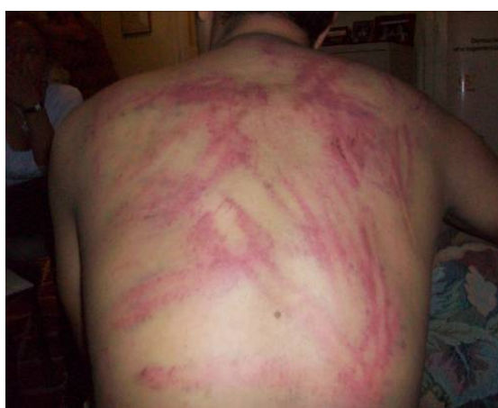
Fotos de víctimas tomadas por el CPTRT

De las inspecciones que realizó el equipo legal del CPTRT durante el 23 de septiembre al Comando Regional (CORE VII) situado en la capital, se detectaron 4 víctimas de tortura que habían sido detenidas en varias colonias cercanas al aeropuerto, dos de ellas eran menores de edad.