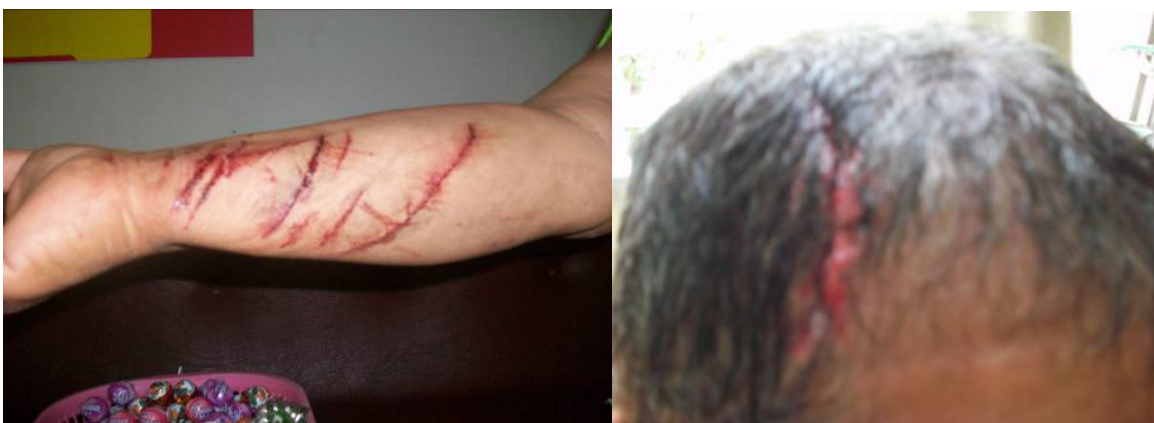
Víctimas atendidas por el CPTRT

Desde el retorno a Honduras del Presidente José Manuel Zelaya el pasado 21 de septiembre se produjo un aumento de la tensión en el país. Durante, los días posteriores a su regreso, el CPTRT tomó testimonio de numerosas víctimas, en su mayoría manifestantes, que se encontraban en las inmediaciones de la Embajada de Brasil, quienes declararon haber sido fuertemente golpeados por las autoridades.