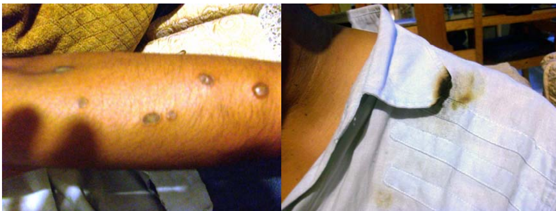
Fotos. Víctima torturada en el CORE VII