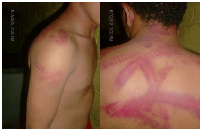
Víctima de tortura asistida por el CPTRT

eso las tengo inflamadas. Nos llevaron a una oficina y después llamaron a una ambulancia que nos atendió algunas heridas. Nos dijeron que nos atendían porque al CORE VII no podíamos entrar todos ensangrentados. Después nos llevaron al CORE VII 12 . Menor de edad.